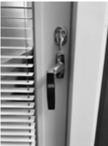
ovi lukittu -asennossa

Lukitusvaihtoehdot. Parvekeovi Abloy LC102 lukkorungolla ja ulko-oven painikkeella. Kaskan painikevaihtoehdot ovat pikakiinnityskaralliset Hoppe Amsterdam ja Hoppe New York. Oveassa on Abloy LC102 -käyttölukko, säädettävä lukon vastarauta ja säätösaranat. Parvekeovi pitkäsulkiijalla ja läpipainikkeella. (Helapaketit 66 ja 67). Parveke-ovi avataan kääntämällä painike vaaka-asentoon. Ovea suljettaessa on painikkeen ehdottomasti oltava vaaka-asennossa, jotta pitkänsalvan teljet eivät vaurioitaisi karmirakennetta. Ovea lukit-taessa painike käännetään alas ja ovi lukitaan sisäpuolella olevasta kääntönupista. Jos oveassa on avainpesä (valittavissa helapaketissa 65), ovi voidaan avata ja lukita myös ulkopuolelta. Aukipi-tolaite lukitsee oven haluttuun tuuletusasentoon kääntämällä painike alas kun ovi on auki.