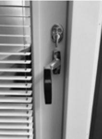
ovi lukittu -asennossa

Lukitusvaihtoehdot. Parvekeovi Abloy LC102 lukkorungolla ja ulko-oven painikkeella. Kaskan painikevaihtoehdot ovat pikakiinnityskaralliset Hoppe Amsterdam ja Hoppe New York. Oveassa on Abloy LC102 -käyttölukko, säädettävä lukon vastarauta ja säätösaranat. Parvekeovi pitkäsulkijalla ja läpipainikkeella. (Helapaketit 66 ja 67). Parveke-ovi avataan kääntämällä painike vaaka-asentoon. Ovea suljettaessa on painikkeen ehdottomasti oltava vaaka-asennossa, jotta pitkänsalvan teljet eivät vaurioitaisi karmirakennetta. Ovea lukit-taessa painike käännetään alas ja ovi lukitaan sisäpuolella olevasta kääntönupista. Jos oveassa on avainpesä (valittavissa helapaketissa 65), ovi voidaan avata ja lukita myös ulkopuolelta. Aukipi-tolaite lukitsee oven haluttuun tuuletusasentoon kääntämällä painike alas kun ovi on auki.